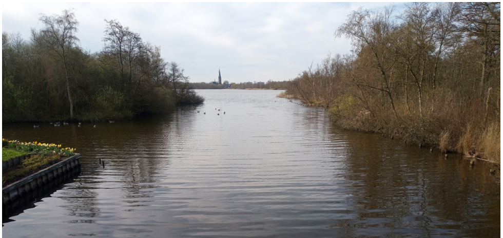
Uitmonding van de Landscheidingsvaart in de Grote Poel met uitzicht op de Poel, gezien vanaf de voetgangersfietsersbrug aan de Doorweg. Situatie februari 2024.; fotoPeter Wetzels

Dit artikel is de bijlage van een brief die de auteur onlangs schreef aan de leden van de Gemeenteraad van Amstelveen.