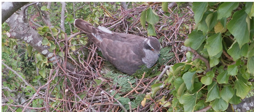
PWC. Man vliegt niet af op 03-05-2022