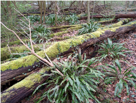
Dit kan gebeuren bij extensief bosbeheer; foto Peter Wetzels