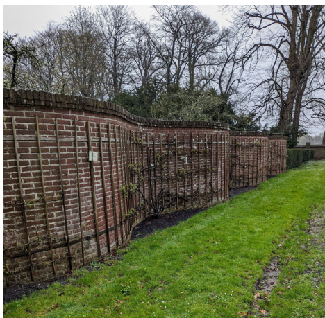
De slangenmuur

In de classicistische tuin ligt het bijzondere rozet (zie foto van het informatie-paneel). Binnen de buxushaagjes bloemenperken met knolspirea, ridderspoor, akelei en dergelijke, maar die waren nog niet in bloei. Ook zijn hier twee van de slechts acht in Nederland overgebleven slangenmuren te vinden. Aan de holle kant van zo'n slingermuur werd leifruit geplant; dat profiteerde van de warmte die de muur opsloeg. De leiperen beginnen in bloei te komen (volgorde bloei fruitbomen over het algemeen: kers - peer - appel, al zijn er variëteiten die een aparte bloeitijd hebben)